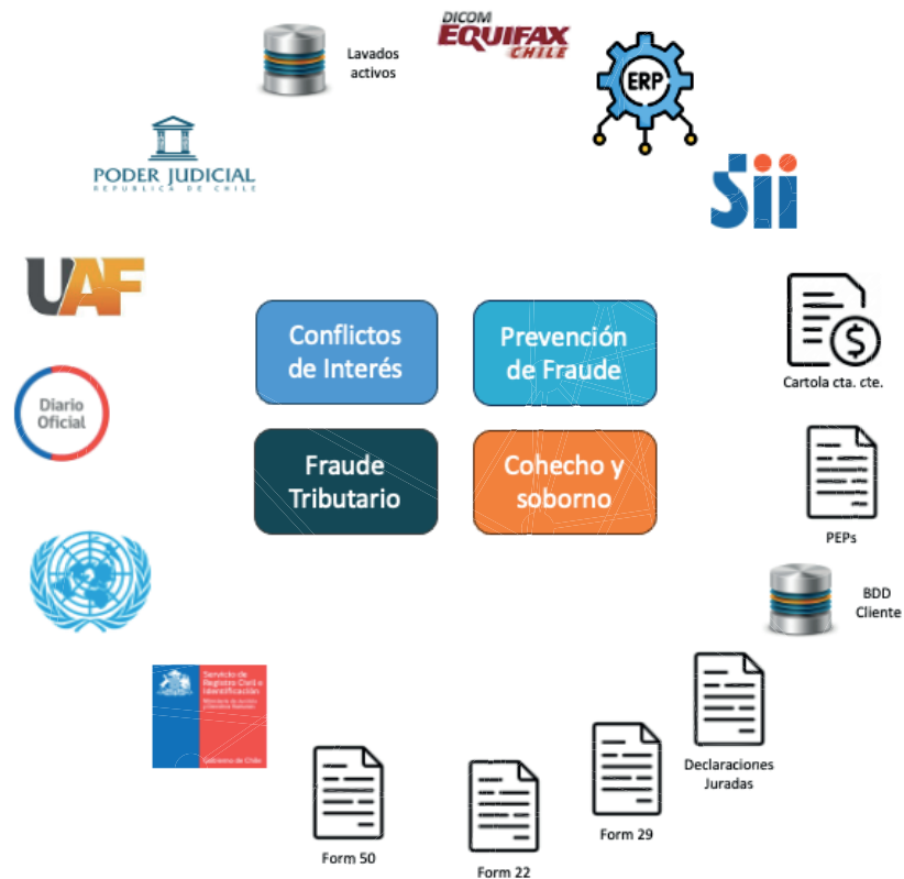
Imagen: fuentes de datos a los que se conecta la plataforma

Ayuda a las empresas a gestionar adecuadamente los conflictos de interés, asegurando la transparencia y la ética en sus operaciones, detectando por ejemplo relaciones personales no divulgadas entre empleados y proveedores a través de análisis de redes sociales y registros de relaciones, preferencia con un proveedor relacionado a trabajador, compañía o funcionarios públicos.