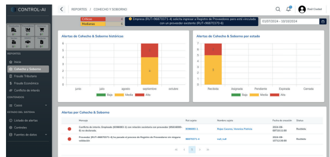
Imagen: Vista reporte de alertas por aspecto de la plataforma.